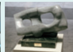
彫刻「生きるかたち」 (作:濱田 亨)