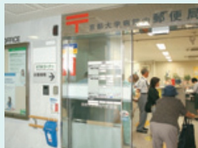
郵便局 外科診療棟1F