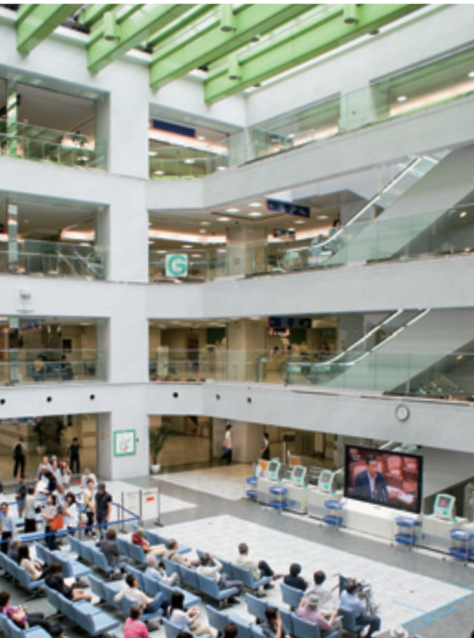
外来診療棟アトリウムホール