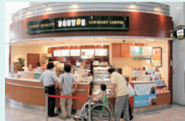
コーヒーショップ