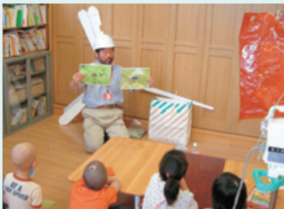
プレイルーム 北病棟3F