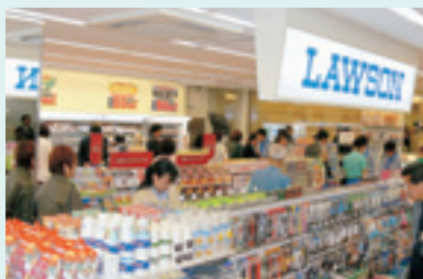
コンビニエンスストア 外来診療棟地階