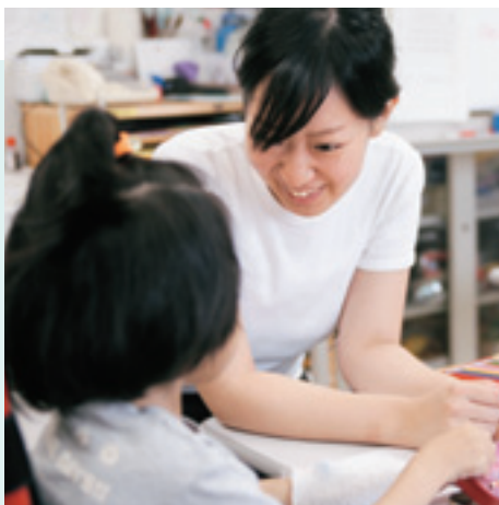
院内学級 外来診療棟3F