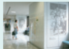
ホスピタルストリート