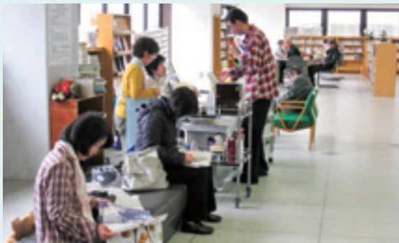
本の広場 外来診療棟3F

入院生活を普段と同じくらい気兼ねなく、不便のないものに。 そんな設備とスタッフを充実させています。