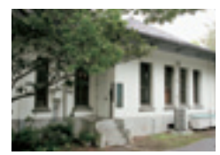
デイ・ケア診療棟