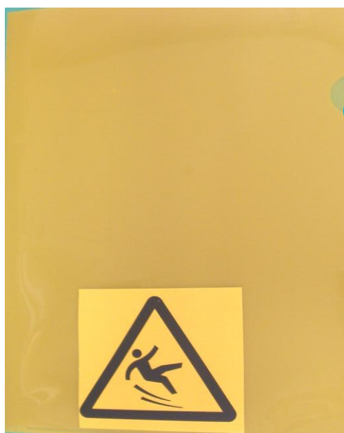
情報共有ファイル