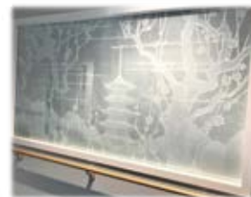
次世代医療・iPS細胞治療研究センターに和紙の壁紙を設置