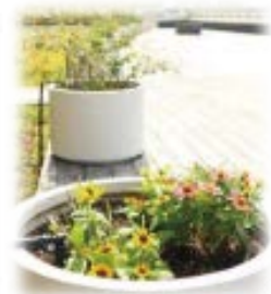
南病棟南側庭園に、患者さんの転落を防止するためのプランターを設置