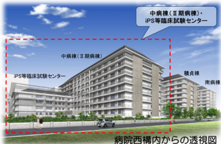
病院西構内からの透視図

現在、平成31年の完成を目指して積貞棟の北側に急性期病棟を中心とした中病棟(Ⅱ期病棟)の建設を進めています。また、京大病院はわが国の臨床研究の中核拠点病院として、iPS細胞研究所などのさまざまな研究科や研究所との連携を押し進め、常に新しい医療に取り組んでおり、京大病院発の新しい医療が数多く発信できるよう中病棟の北側にiPS等臨床試験センターの建設も同時に進めています。