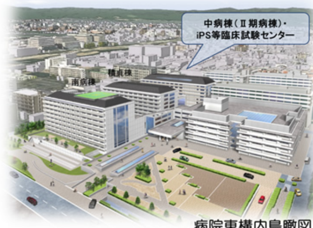
病院東構内鳥瞰図

現在、平成31年の完成を目指して積貞棟の北側に急性期病棟を中心とした中病棟(Ⅱ期病棟)の建設を進めています。また、京大病院はわが国の臨床研究の中核拠点病院として、iPS細胞研究所などのさまざまな研究科や研究所との連携を押し進め、常に新しい医療に取り組んでおり、京大病院発の新しい医療が数多く発信できるよう中病棟の北側にiPS等臨床試験センターの建設も同時に進めています。