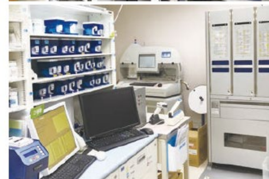
最新機器による調剤支援