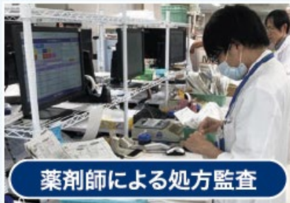
薬剤師による処方監査

調剤・監査は薬剤師の最も重要な仕事の一つです。当院では、薬剤師はチェックシートやカルテを確認しながら処方監査を重点的に行います。薬剤助手やピッキングマシンが医薬品の取り揃えを行い、別の薬剤師が最終監査をするという流れで、調剤を行っています。