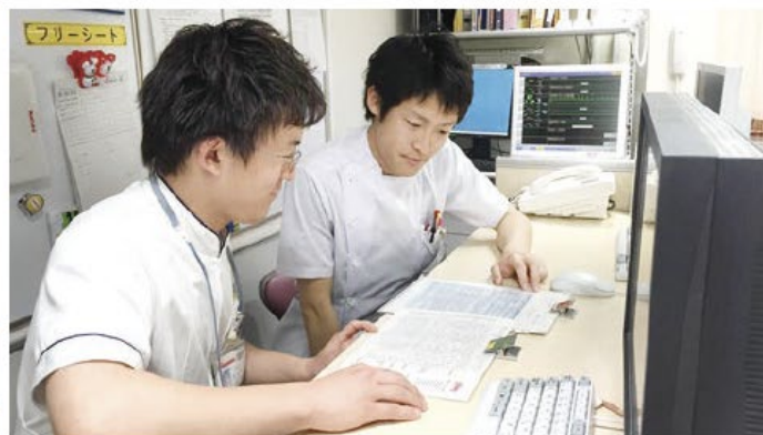
医療スタッフとのカンファレンス