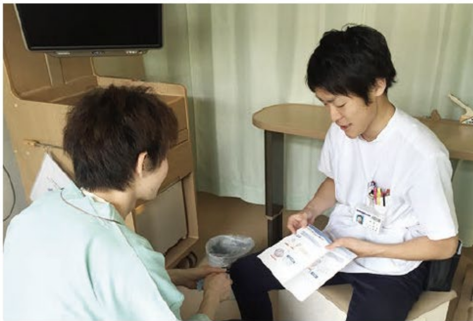
病棟薬剤師による服薬指導