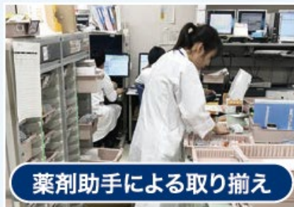
薬剤助手による取り揃え