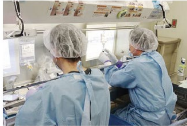
機械化された調製システム

モニター、バーコード、天秤のついた監査システムで、医薬品の照合、採取量の確認・記録等を行いながら、1人で調製作業を行います。別に薬剤師が最終チェックを行い、患者さんに投与されます。