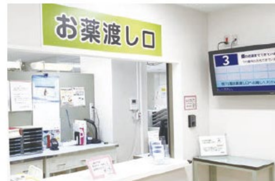
外来棟地下1Fお薬渡し口