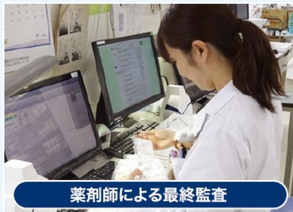
薬剤師による最終監査