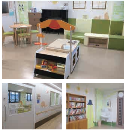
北病棟4・5階： 子ども医療センターのプレイルーム刷新