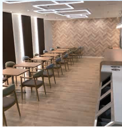
外来棟地階： 飲食可能なイートインスペースを整備