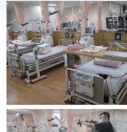
中央診療棟3階： 透折ベッド映像サービスリニューアル